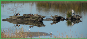
Unberührte Natur am Hochwasserrückhaltebecken

Direktkandidatin für den Wahlbezirk 3 (Westerfilde / Bodelschwingh) Platz 1 auf der BV-Liste Diplompädagogin. Seit 2007 Mitglied der Bezirksvertretung Mengede, seit Ende 2009 Fraktionssprecherin für Bündnis 90/ Die Grünen. Schwerpunkte: Soziales, Stadtentwicklung, Wohnen, Naturschutz und Freiraumentwicklung Einsatz für ein gleichberechtigtes Miteinander in einem lebendigen Stadtteil mit grünem Gesicht, einem Ort der Begegnung und einem Platz, wo man gerne wohnen und alt werden will. isabella.knappmann@gruene-dortmund.de