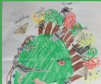
Biodiversität erhalten: Auf der Voglwiese in Oestrich begegnen sich Mensch und Natur, Jung und Alt.